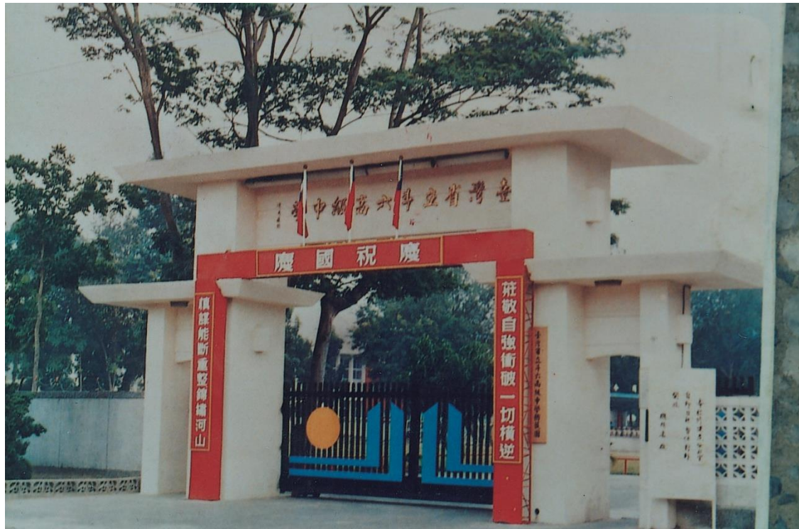
斗六中學昔日於民生路舊校門