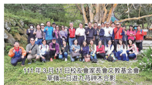
111年3月11日校友會家長會文教基金會 草嶺一日遊苑苑神木合影